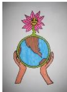
Logo gagnant du concours 2011