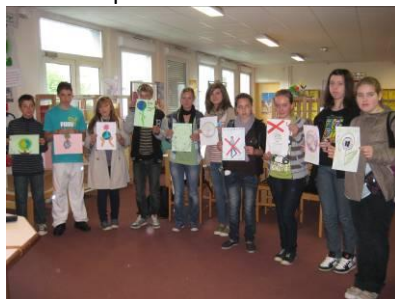
Lauréats du concours Logos DD

Evolution envisagée : Ouvrir le bureau à plus de bonne volonté.